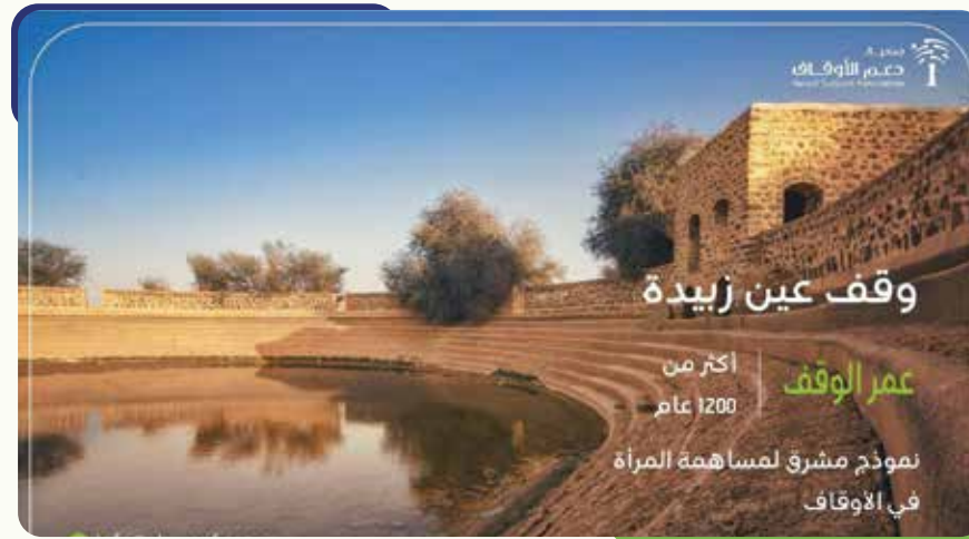
يوم المرأة العالمي