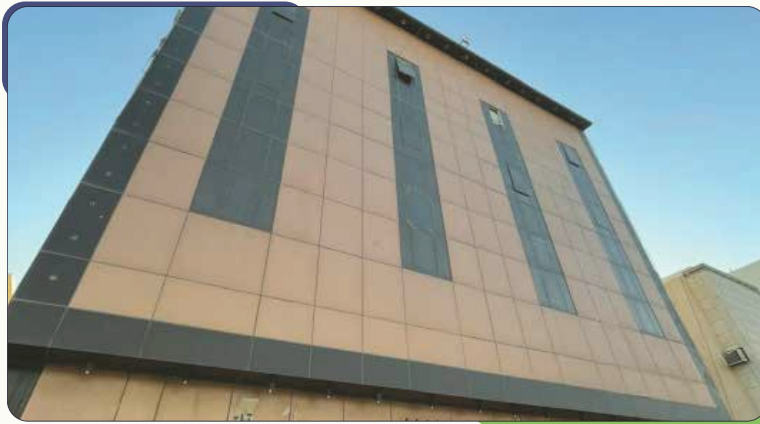
وقف حاتم بني العزيزية