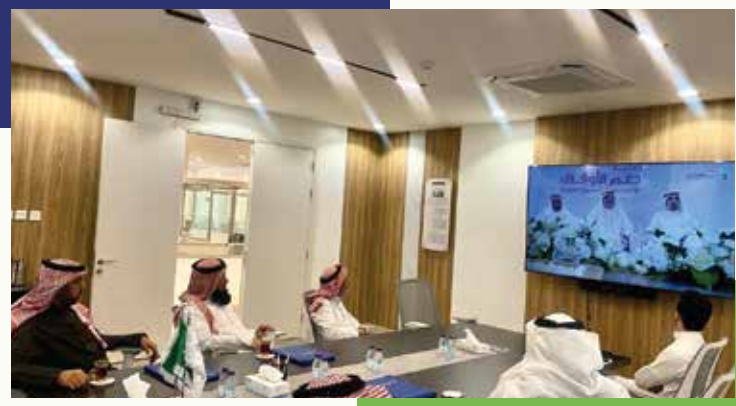
استضافة وفد من جمعية مراكز الأحياء