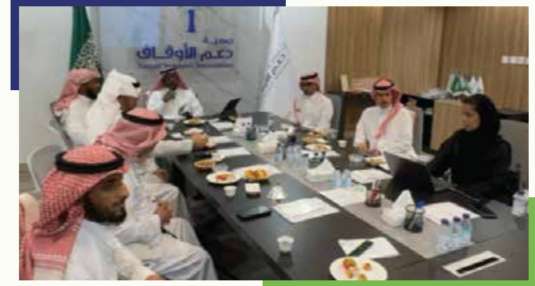
استضافت الجمعية وفد من جمعية أصدقاء لاعبي كرة القدم الخيرية