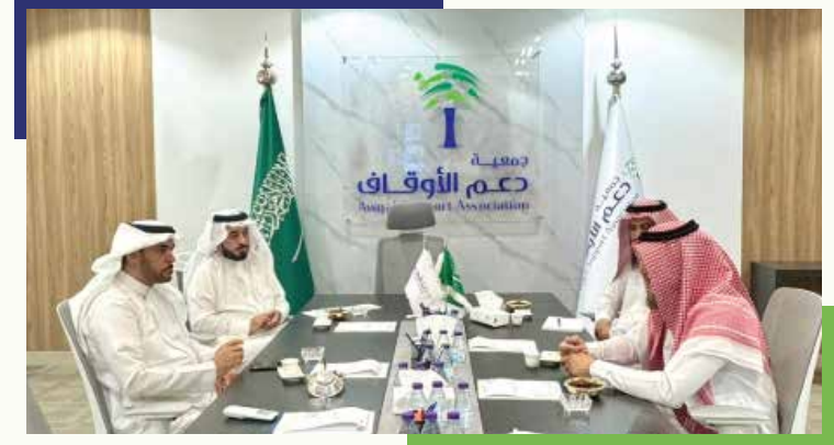
زيارة أمين عام أوقاف جامعة أم القرى الدكتور/ عبدالله منكابو