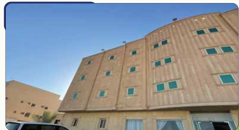
وقف حاتم بني القادسية