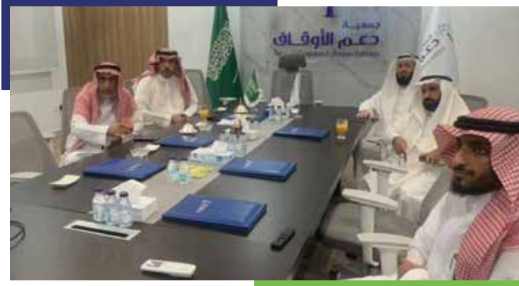
استضافة وفد من أوقاف محمد الراجحي