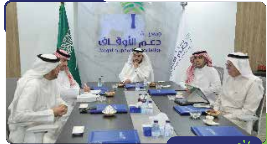
الاجتماع الثالث لمجلس الإدارة