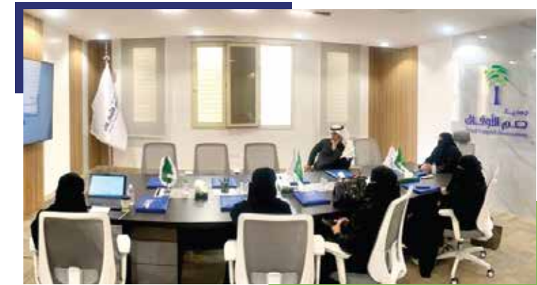
استضافة وفد مؤسسة سيد الوقفية