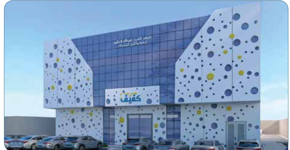
وقف جمعية كيف (تحت الإنشاء)