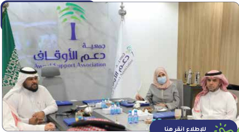
الاجتماع الأول لمجلس الإدارة