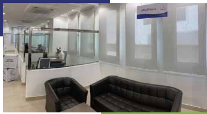
مقر حاضنة الأوقاف