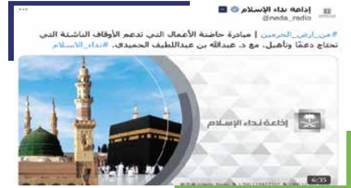
التغطية الإعلامية عن المبادرة