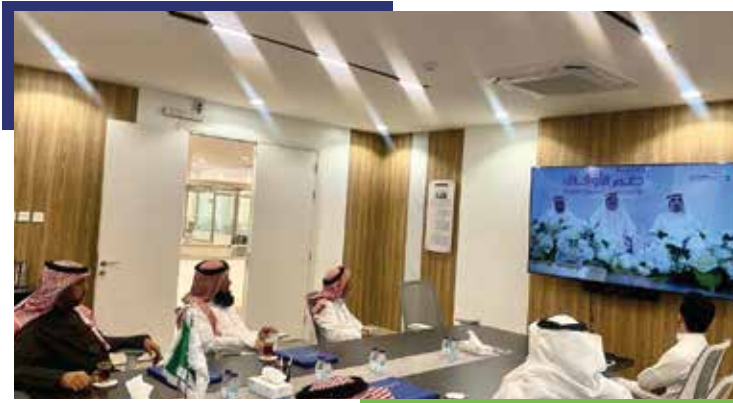
استضافة وفد المركز السعودي للتلاوات القرآنية والأحاديث النبوية