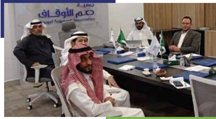
زيارة ممثل المركز الوطني لتطوير القطاع غير الربحي للجمعية.