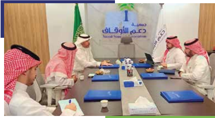
زيارة الراجحي المالية للجمعية