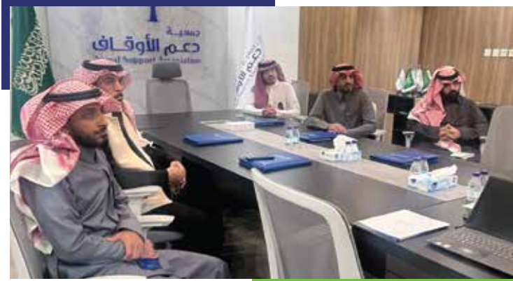
زيارة وفد جامعة الإمام محمد بن سعود الإسلامية