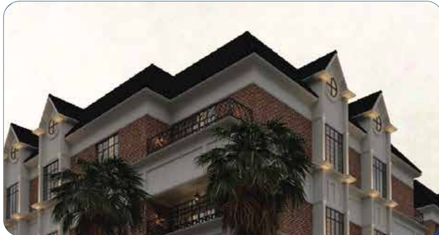
وقف جمعية أصول (تم تمكينه)