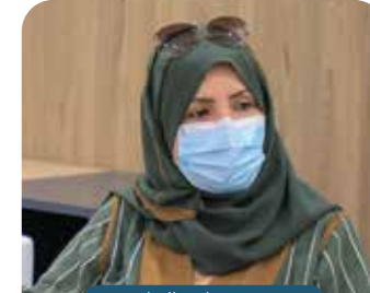
عضو مجلس الإدارة جواهر بنت محمد بن سلطان