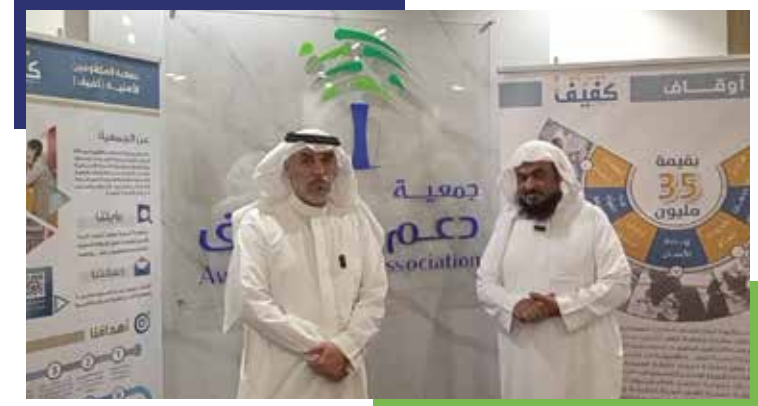
زيارة المدير التنفيذي لجمعية المكفوفين بالرياض لمقر الجمعية