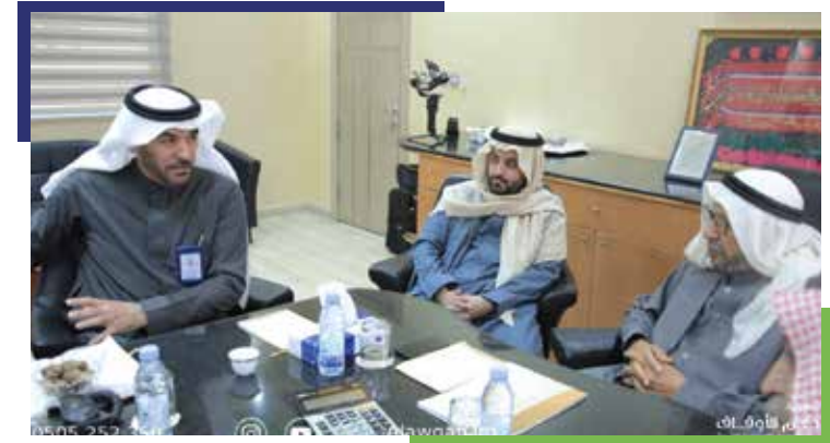
زيارة الرئيس التنفيذي للشيخ حمد بن سعيدان