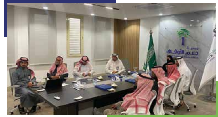
زيارة صاحبة السمو الملكي الأميرة فهدة بنت عبدالله بن عبدالعزيز آل سعود للجمعية