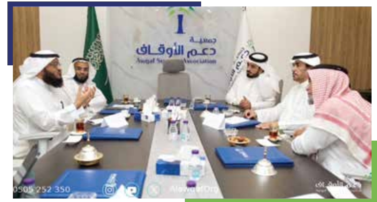
استضافة الجمعية وفد من إدارة تعليم الرياض